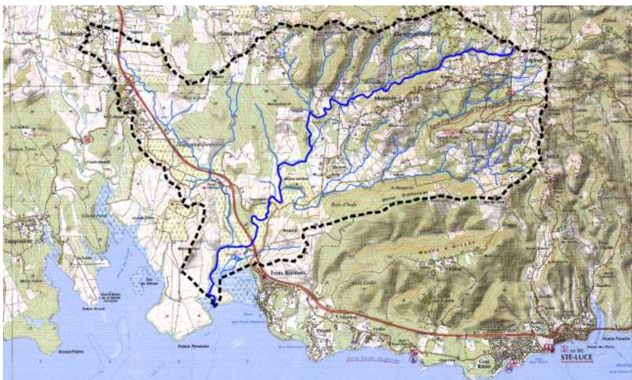
Figure 1 : Le bassin versant de la rivière Oman

Les origines de la dégradation de la rivière Oman aval peuvent être situées sur l'ensemble du bassin versant. Le périmètre de la présente étude est donc la totalité du bassin versant (cf. Figure 1).