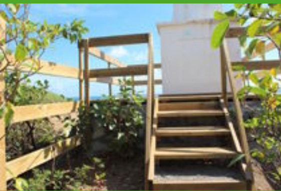
Plateforme et garde-corps