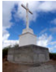
Socle de la croix - Avant / Après