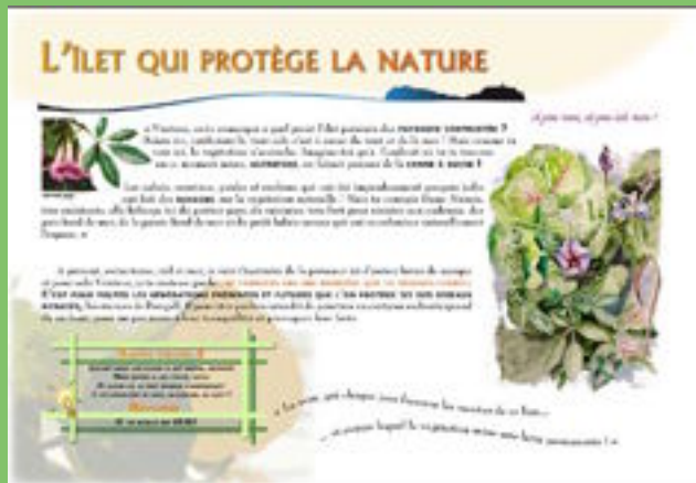
Exemple de visuel de panneau