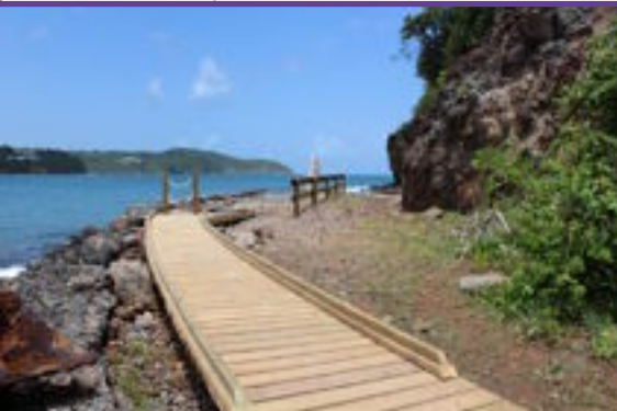
Les rails de bois