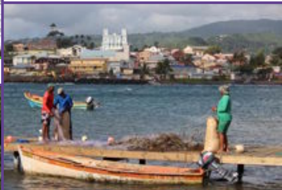
Ponton et marins-pêcheurs