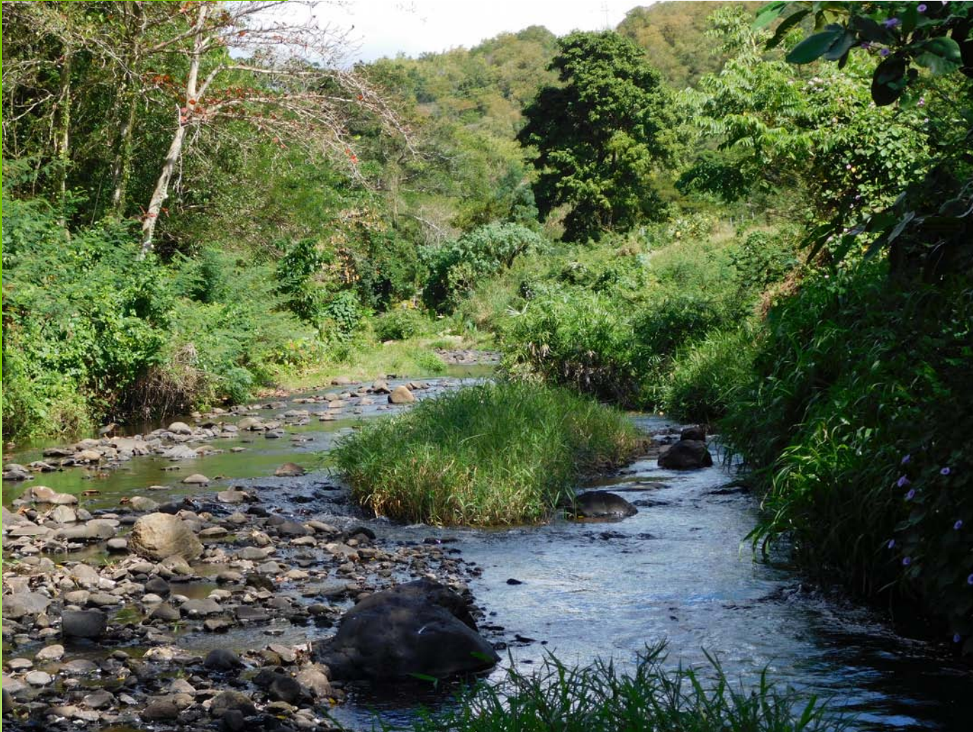
Rivière Case-Navire, février 2017.