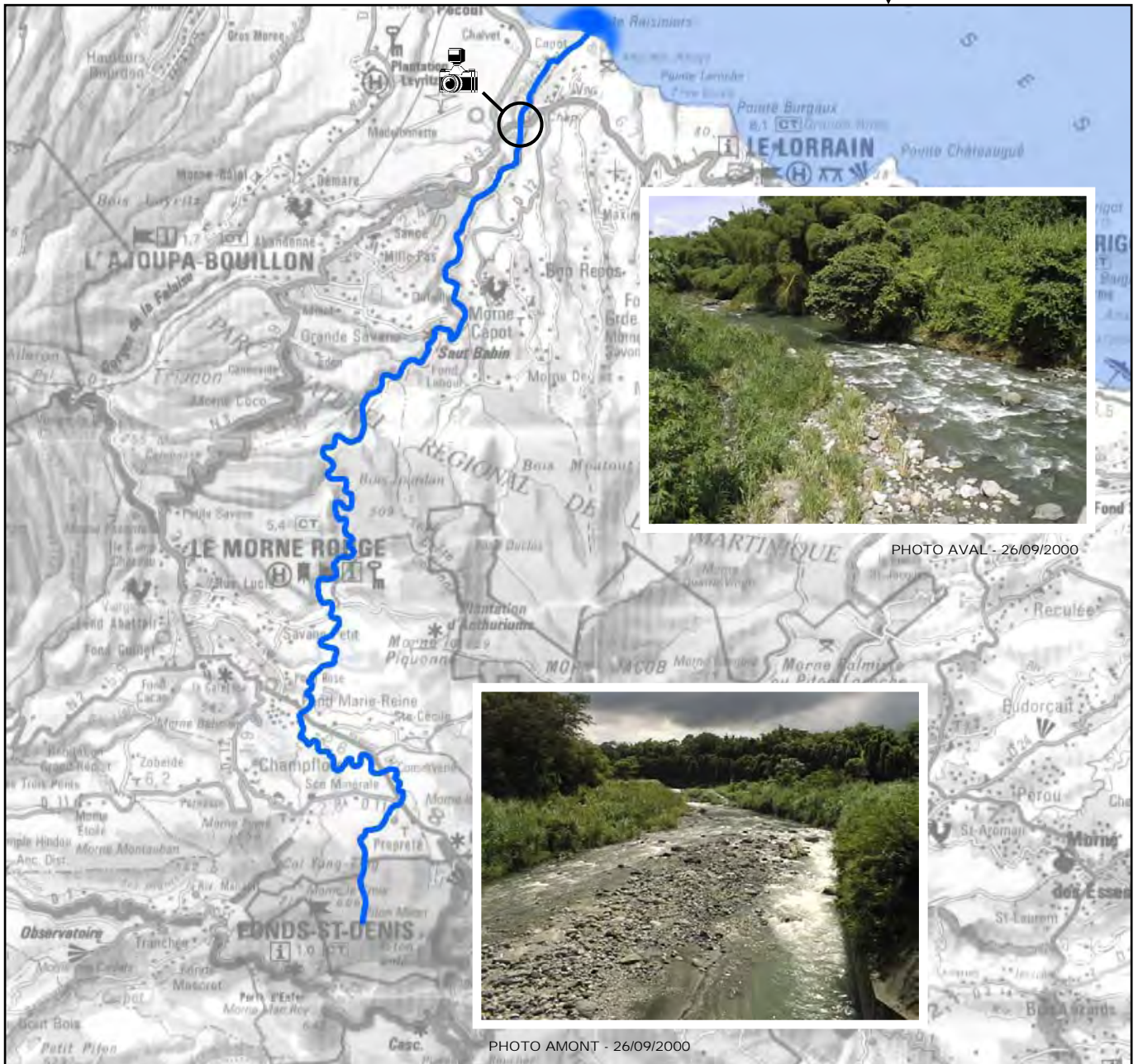
PHOTO AMONT - 26/09/2000